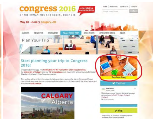
Annnonce en ligne – page intérieure

Les annonceurs doivent fournir leurs annonces dans CHACUNE des dimensions suivantes :