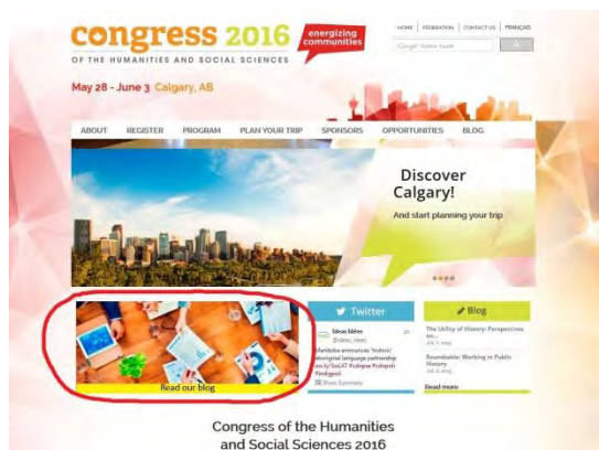
Annnonce en ligne – page d'accueil

Toutes les annonces en ligne paraissent aussi bien sur la page d'accueil que dans les pages intérieures du site Web du Congrès. Toute annonce bénéficie de la même visibilité grâce à une rotation d'image automatisée.